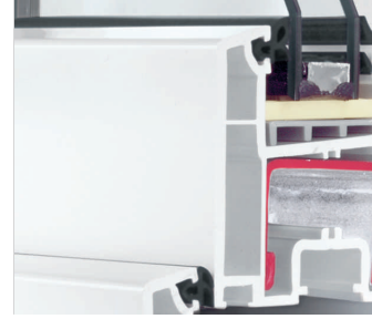
Düz Kanat Tasarımı

REHAU Euro-Design 60 yuvarlak kombinasyonları belirgin şekilde uyumlu bir sonuç ortaya çıkarır. Bu sistemde tüm beklentilerinizin karşılığını bulacaksınız.